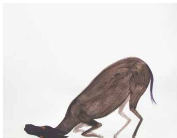
• Sans titre . 2011. Tempera sur papier. 29,7 × 21 cm

D'autres séries sont basées sur des principes de lignes ou de réseaux – notamment les Contournements (2008) – ou encore de points, de taches, de liaisons, comme aussi de ratures, de coulures, d'effacements, en particulier dans les séries Washed confettis (2006-2007) et Washed landscapes (2007-2008). Le mode opératoire de ces derniers dessins fait qu'il s'agit « de