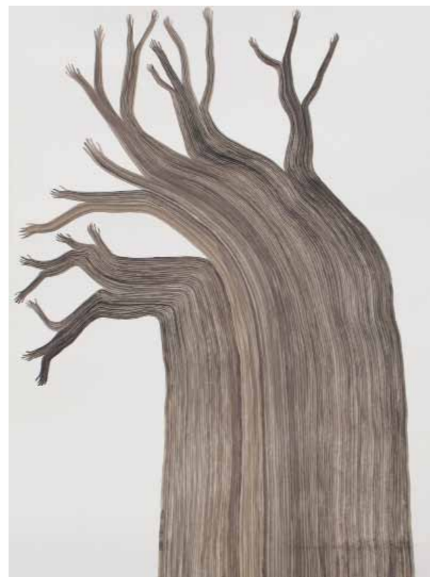
• Sans titre . 2010. Tempera sur papier. 110 × 98 cm

Quand on se retrouve face à un mur de ses dessins, aucun élément n'est interprétable isolément. Au premier regard, on remarque surtout les disparités, les dissemblances. L'ordre caché sous-jacent qui les relie se laisse pressentir plutôt que de se donner au premier regard. Il se construit au fur et à mesure des progrès de l'observation, à partir de l'inventaire patient des différences, des écarts et des analogies que l'on repère. On perçoit, d'abord confusément, puis de plus en plus clairement que les structures et les liens par lesquels les dessins sont ici assemblés ne sont pas imposés du dehors. À tout instant, un autre ordre est possible ; que nous avons nous-mêmes la liberté d'instaurer par le déplacement de notre corps et de notre regard face aux dessins, en créant de nouvelles variations, de nouvelles grilles de lecture, de nouveaux montages, en vertu de phénomènes d'attraction ou d'éloignement réciproques.