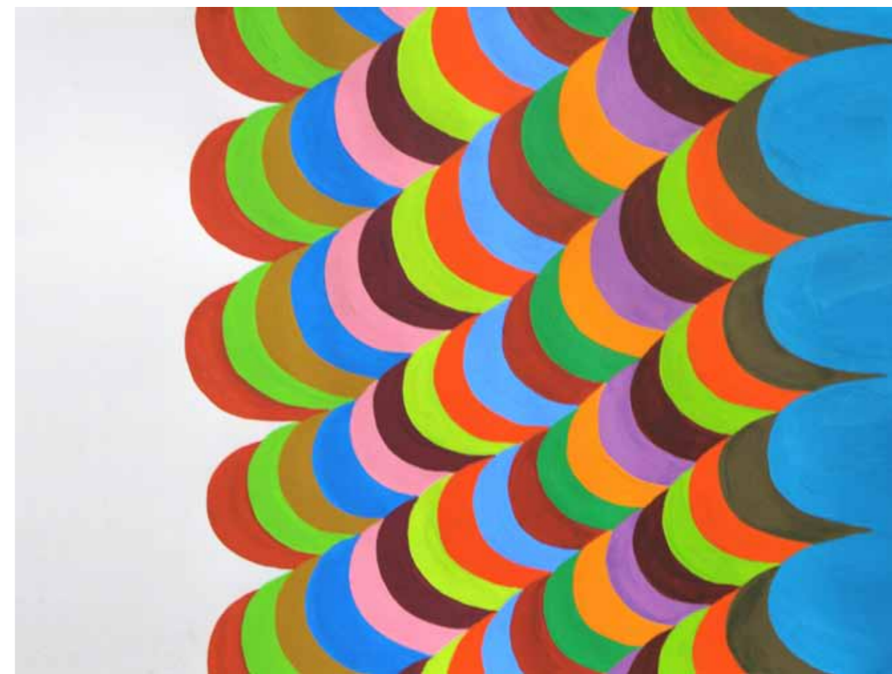
• Sans titre . 2008. Gouache sur papier. 30 × 42 cm